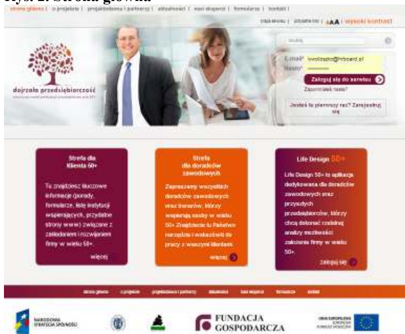
Rys. 2. Strona główna